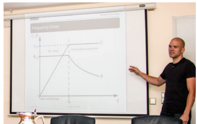
Technische Zusammenhänge – leicht verständlich erklärt