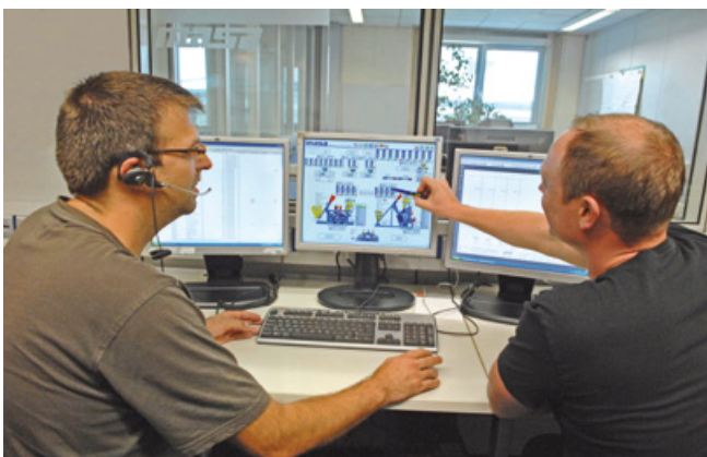
Unsere Spezialisten im Fernwartungseinsatz

Masa F-E-S Support Center Telefon: 02632 92 92 88 E-Mail: hotline@masa-group.com