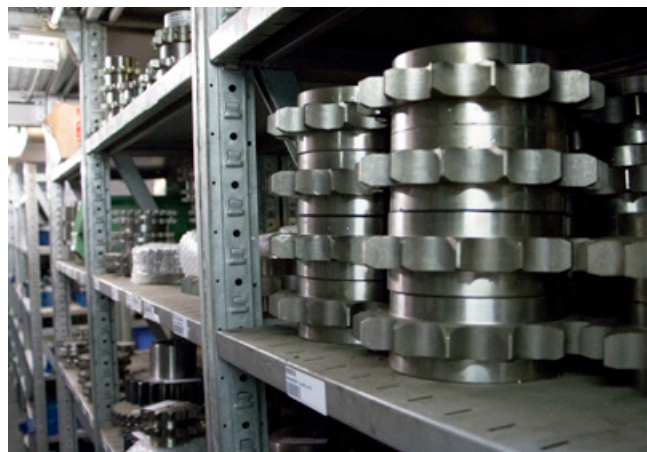
Zeitnaher Versand durch eine gezielte Lagerhaltung von Ersatzteilen