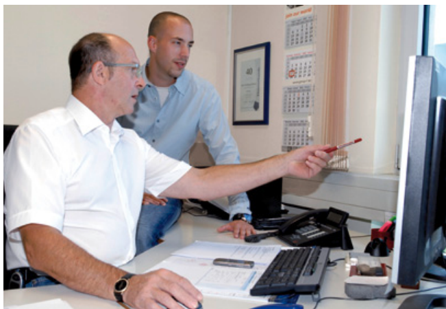
Erfahrung zahlt sich aus: Unsere Mitarbeiter beraten kompetent und zuverlässig

Unsere Mitarbeiter sind per Telefon, Fax, E-Mail oder mit einer gezielten Ersatzteilanfrage über unsere Homepage erreichbar.