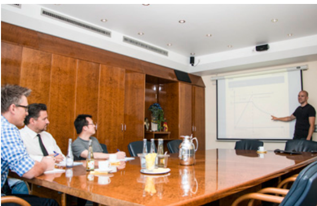
Masa in-house Schulung